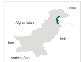
Processed & Prepared by: PPAF GIS Laboratory