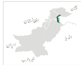
مرتب شدہ بذریعہ پی پی اے ایف۔ جی آئی ایس لیبارری